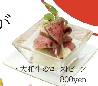
・大和牛のローストビーフ 800yen