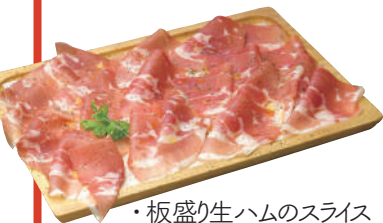
・板盛り生ハムのスライス 1,200yen/80g