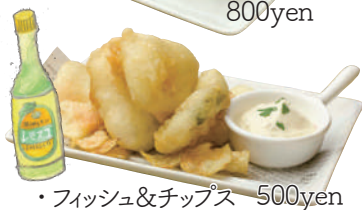
・フィッシュ&チップス 500yen