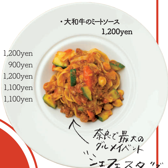
・大和牛のミートソース 1,200yen